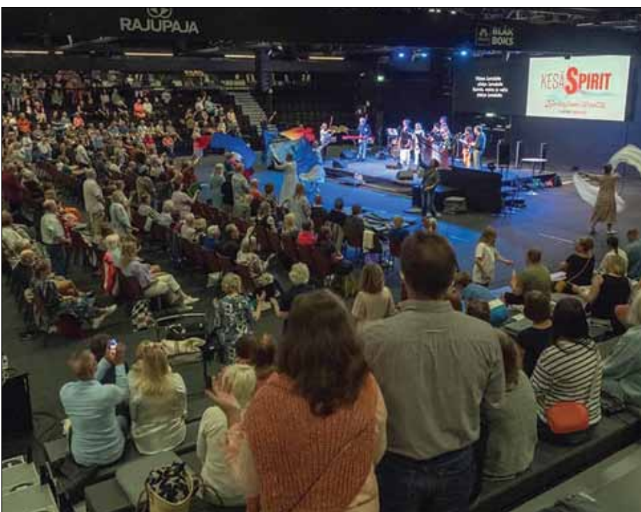
Hengen uudistus kirkossamme KesäSpirit-tapahtuma Lempäälän Ideaparkissa.