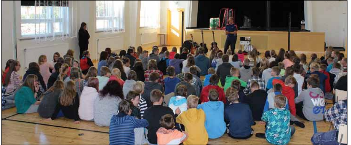
Kaikki oppilaat kuuntelevat suurella mielenkiinnolla Rikun juttuja.

- Kuten sanoin, näitä juttuja riittäisi loputtomiin. Aina minua itseäni hämmästyttää, miten oppilaat keskittyvät kuuntelemaan. Monesti minulta pyydetään myös kirjoittamiani kirjoja lahjaksi, joita minulla on tietysti aina mukana. Halutuin kirja on ehdottomasti KK kuolemankaupias.