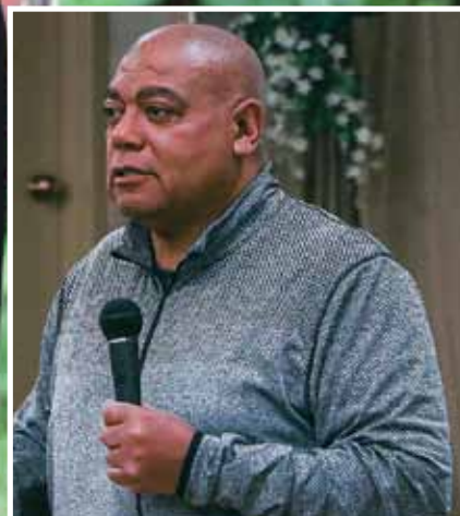
Dean kertoi taivaan ihanuudesta.