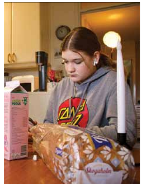
Teini-ikäisten kysymyksiä otetaan esille draama-sarjassa, jonka nimenä suomeksi on: Rakas Jumala, minulla on ongelma.