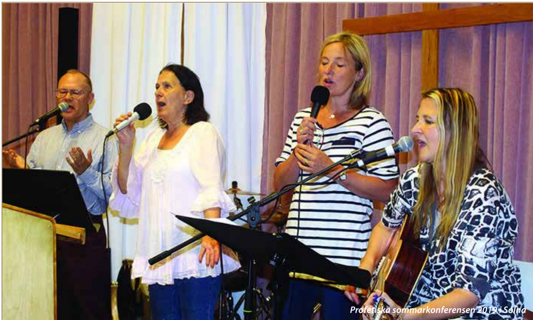
Profetiska sommarkonferensen 2019 i Solna

Församlingen Kristet Center Solna (KCS) arrangerade en stark profetisk sommarkonferens mellan 26 och 30 juni. Evenemanget samlade flera hundra människor och hölls i församlingens egna lokaler vid Hagalundsgatan 9 i Solna.