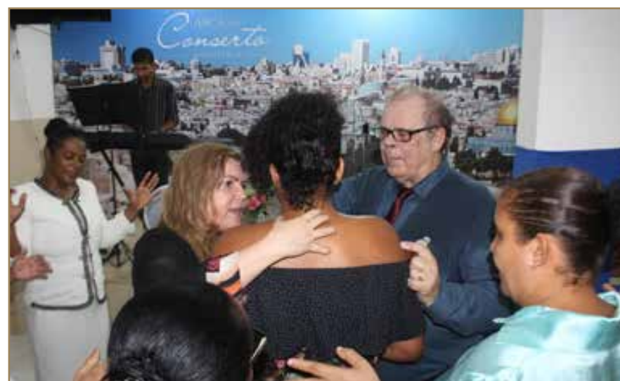
Missionsresa i Salvador-Bahia, Brasilien